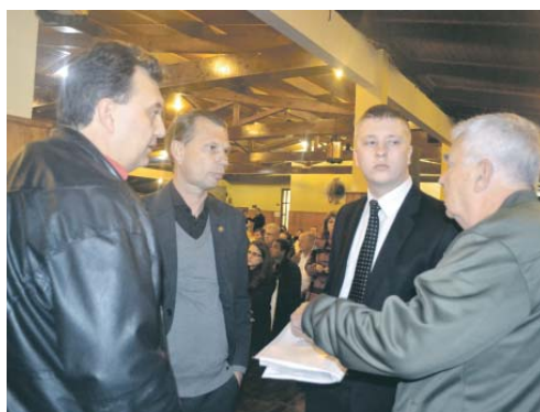
Na audiência pública para entrega do dossiê criado pelos moradores