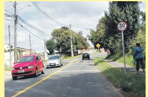
Lombada na Rua José Bajerski