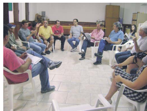
Reunião de moradores discutindo a revitalização em trecho da rua Mateus Leme