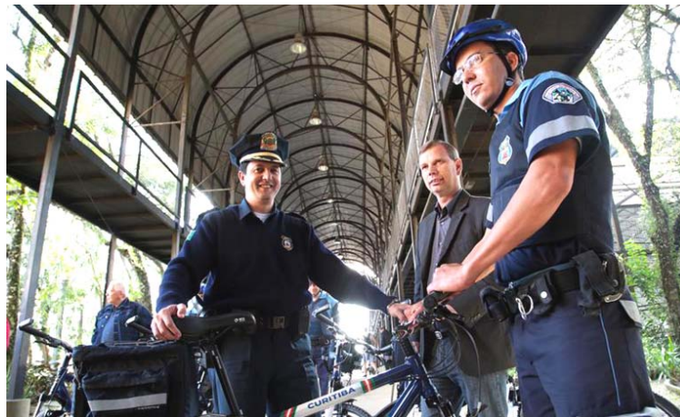
Presença da Guarda Municipal é necessária e deve ser ampliada

No requerimento (062.00164.2015), o vereador questionou a prefeitura sobre quantos atendimentos foram realizados pela GM na regional em 2015; quantos dos atendimentos estavam relacionados a assaltos e o local das ocorrências; e quais foram os outros tipos de ocorrências registradas. "É de extrema importância conhecermos a realidade da região, para propor a criação de políticas públicas que aproximem a instituição da comunidade, visando melhores resultados na segurança pública", explicou. Na resposta