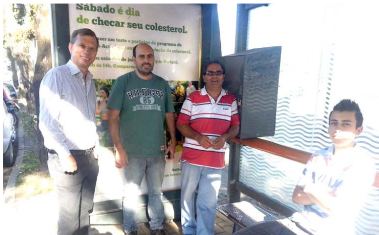
Taxistas agradecem o vereador pela ampliação do ponto de táxi em frente ao Terminal Santa Felicidade

Quem passa pela Praça San Marco, ou frequenta o local com a família nas terças-feiras para comer o famoso pastelinho e levar verduras fresquinhas pra casa, já estava acostumado com uma torneira, de grande utilidade, que era disponibilizada à população. Contudo, a prefeitura solicitou a retirada do ponto de água, prejudicando de imediato os feirantes e taxistas.