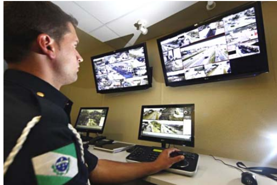
A implantação de câmeras de monitoramento na região é uma necessidade urgente

Santa Felicidade é considerada o maior centro gastronômico do sul do